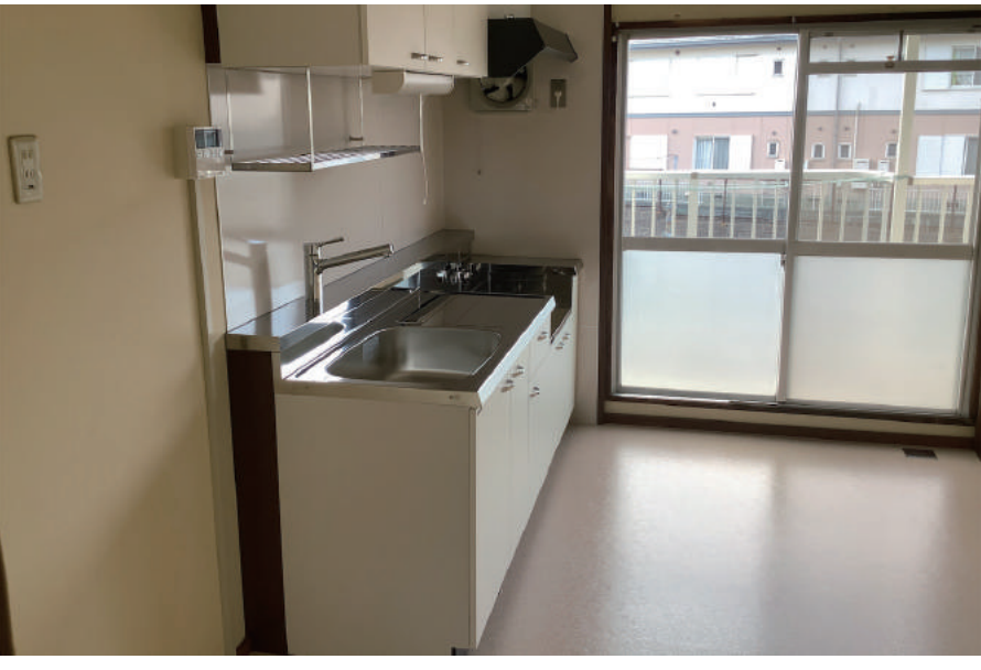
長浦県営住宅 1号棟他住居改善工事 (令和2年度)

〒299-1121 君津市常代 1-12-26 TEL : 0439-55-6511 FAX : 0439-52-5676 URL http://www.taisei-ken.com/