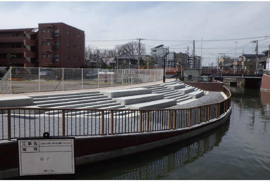
広域河川改修工事(境川護岸工その3 6)

〒279-0001 浦安市当代島 1-26-21 TEL : 047-351-8451 FAX : 047-351-8342