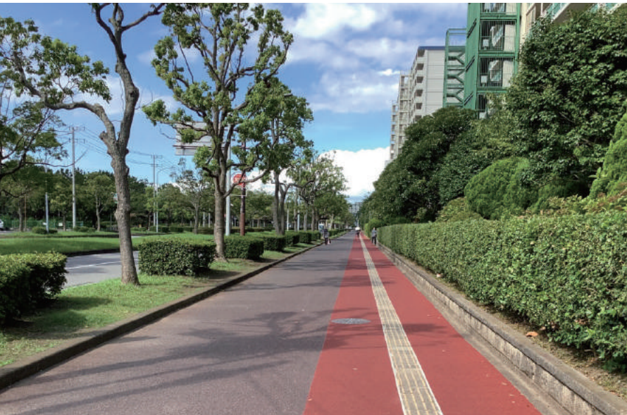
千葉市美浜区真砂2丁目16番地先配水管整備工事

〒261-0002 千葉市美浜区新港 139-2 TEL : 043-248-1471 FAX : 043-241-1875 URL https://www.keiyo-koukan.co.jp/