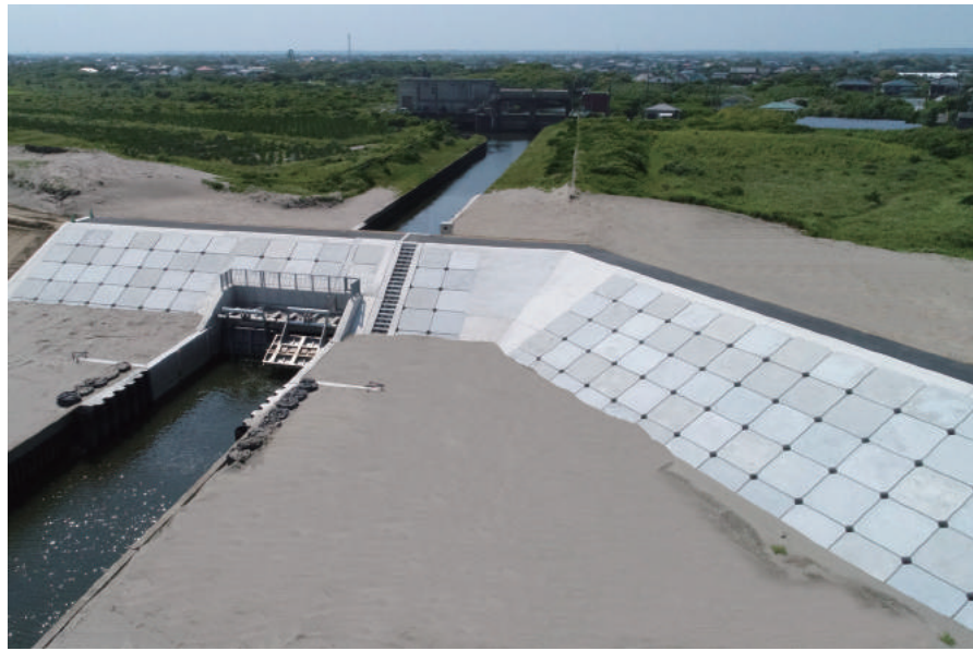
海岸基盤整備(復興)工事(大布川樋門工)

〒289-1726 山武郡横芝光町木戸 10110 TEL : 0479-84-1221 FAX : 0479-84-0179 URL https://www.abiru-const.co.jp/