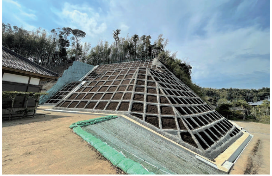
急傾斜地崩壊対策工事 (柴田2 法面保護工)