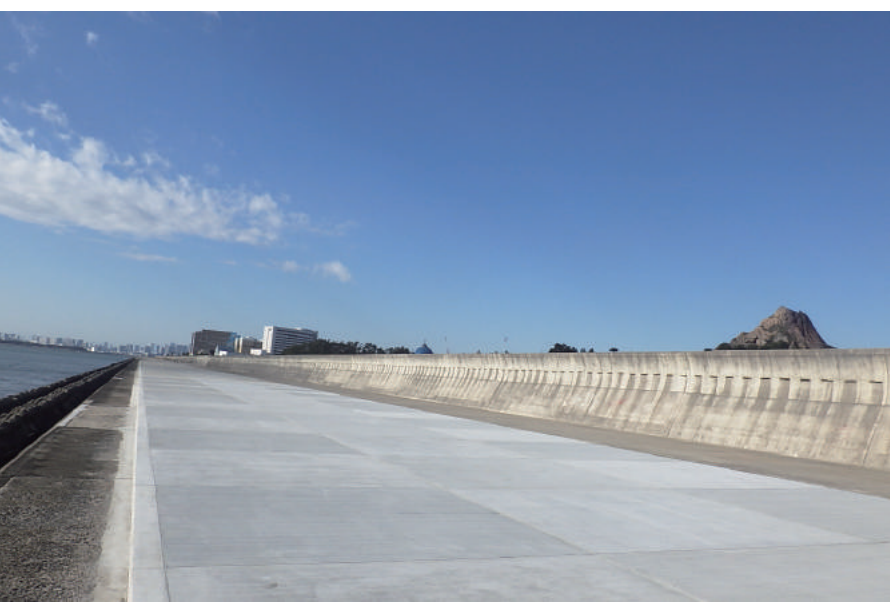
海岸基盤整備工事(浦安海岸水叩工その1 6)

〒279-0041 浦安市堀江 1-6-2 TEL : 047-351-2394 FAX : 047-351-2391 URL http://www.taguchi-kensetsu.co.jp/