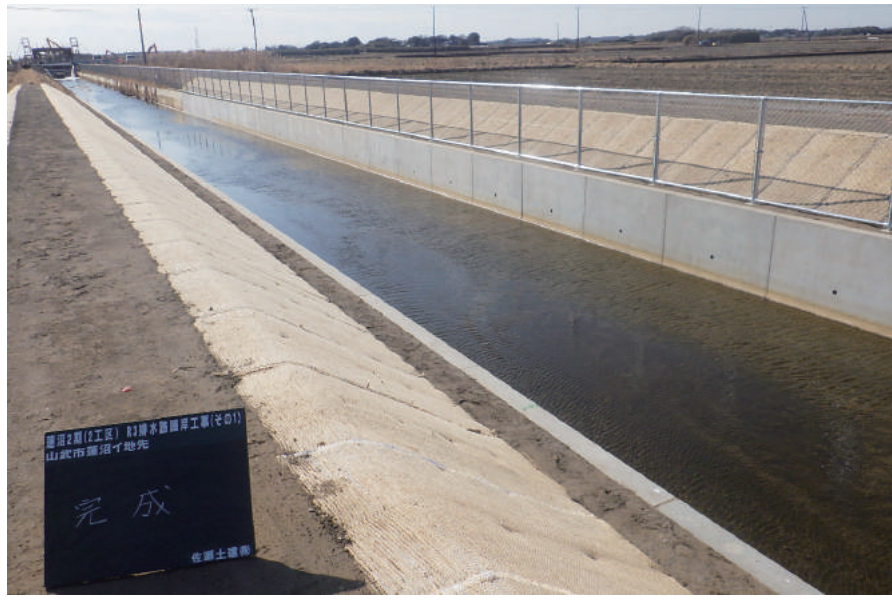
蓮沼2期(2工区) R3排水路護岸工事(その1)

〒289-1802 山武市蓮沼口 3129 TEL : 0475-86-3141 FAX : 0475-86-3143