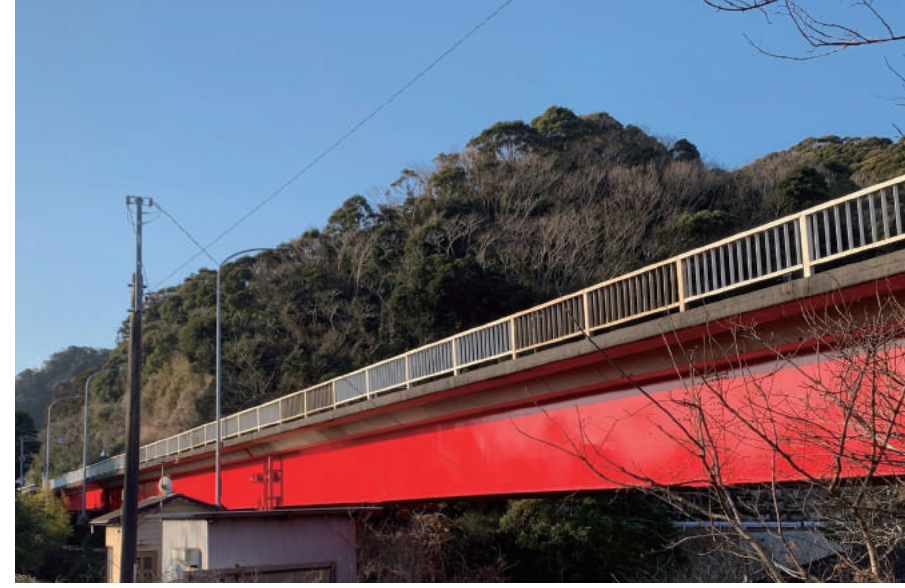
道路メンテナンス（橋梁）工事（新波太橋・補修工）

〒271-0065 松戸市南花島 3-51-8 TEL : 047-362-0656 FAX : 047-361-2602 URL http://www.moriyamatoko.co.jp/