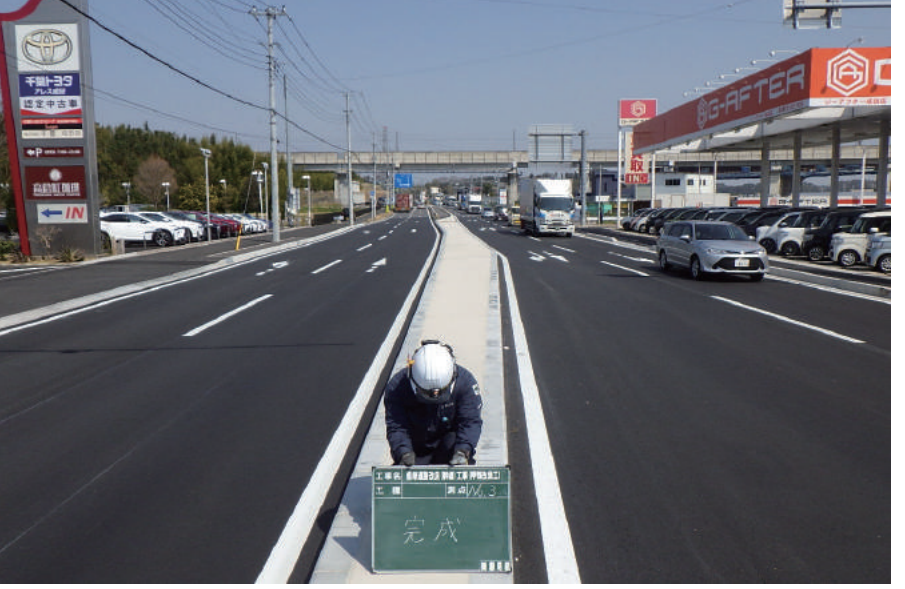
県単道路改良 (幹線) 工事 (押畑改良工)