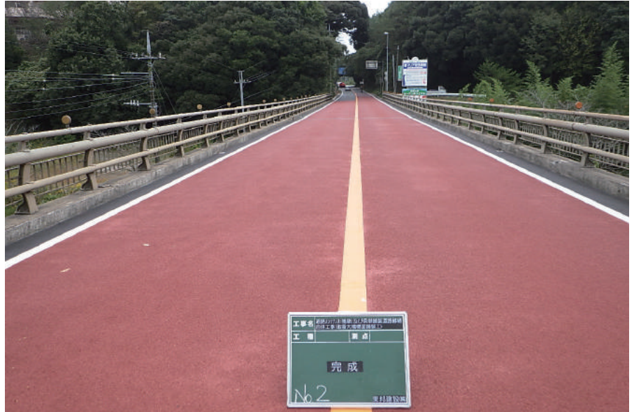
道路メンテナンス (橋梁) 及び 県単舗装道路修繕合併工事 (取香大橋橋面舗装工)