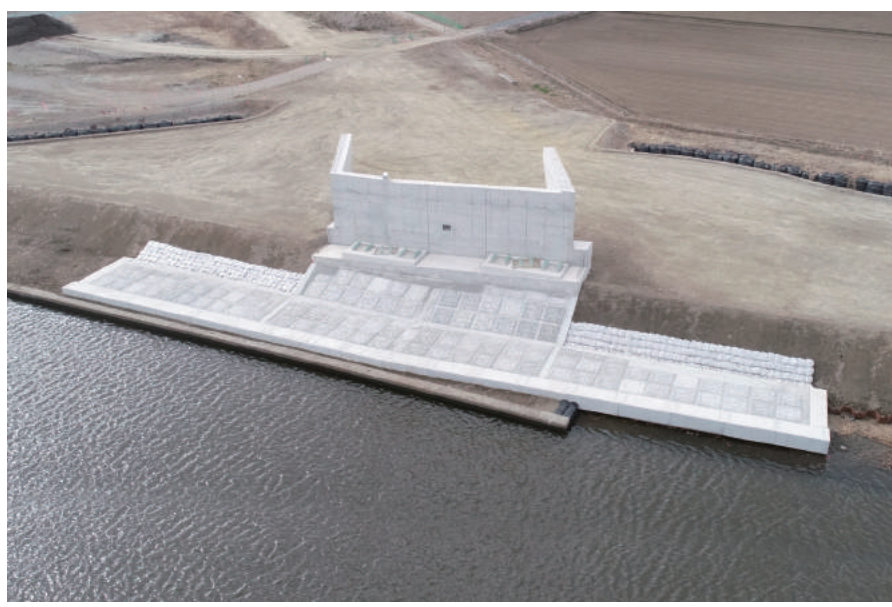
ふさのくに観光道路工事(仮称黒部川新橋A2橋台工)

〒287-0002 香取市北 2-6-3 TEL : 0478-55-1511 FAX : 0478-55-1460 URL http://www.ishiicon.co.jp/