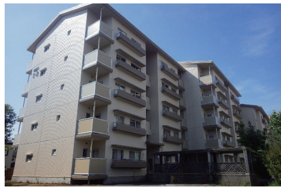
生実県営住宅S-1~3号棟外装改修他工事(令和2年度)

〒287-0002 香取市北 2-6-3 TEL : 0478-55-1511 FAX : 0478-55-1460 URL http://www.ishiicon.co.jp/