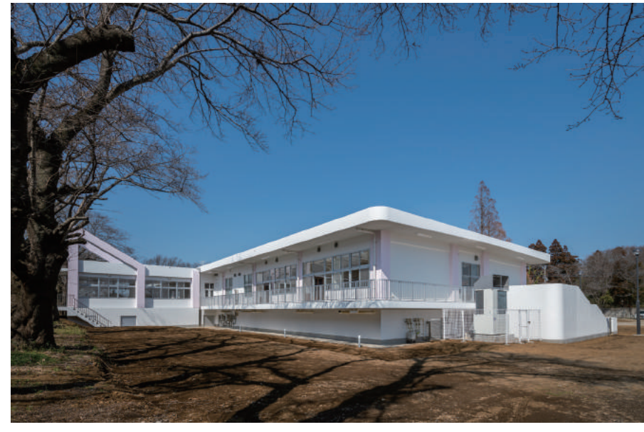
千葉県立桜が丘特別支援学校教室棟増築工事

〒289-1726 山武郡横芝光町木戸 10110 TEL : 0479-84-1221 FAX : 0479-84-0179 URL https://www.abiru-const.co.jp/