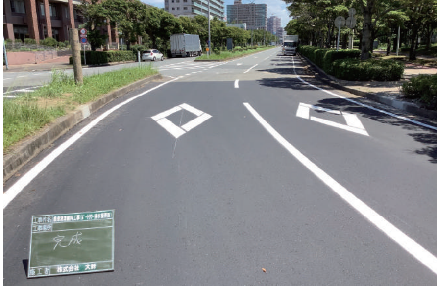
県単港湾維持工事（ポートタワー排水管更新）

〒265-0077 千葉市若葉区御成台 3-1168-23 TEL : 043-236-7855 FAX : 043-236-7856 URL https://daikan55.co.jp/