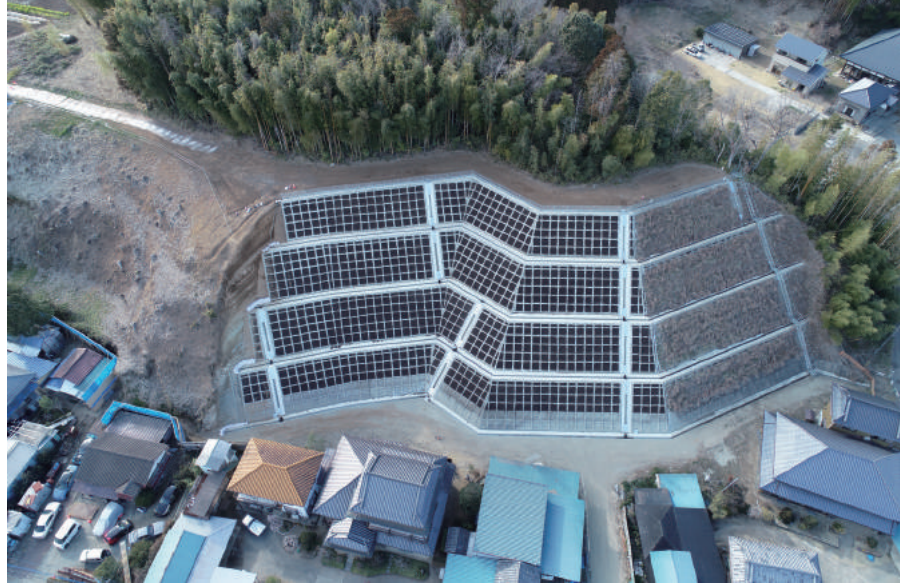
土砂災害防止 (急傾斜) 工事 (辺田その2)