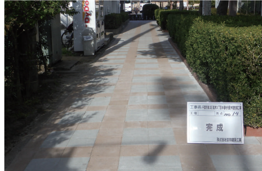
千葉市美浜区高洲3丁目8番地先配水管整備工事

〒263-0051 千葉市稲毛区園生町 245-3 TEL : 043-251-8614 FAX : 043-251-5536 URL http://www.yoshidahome.jp/