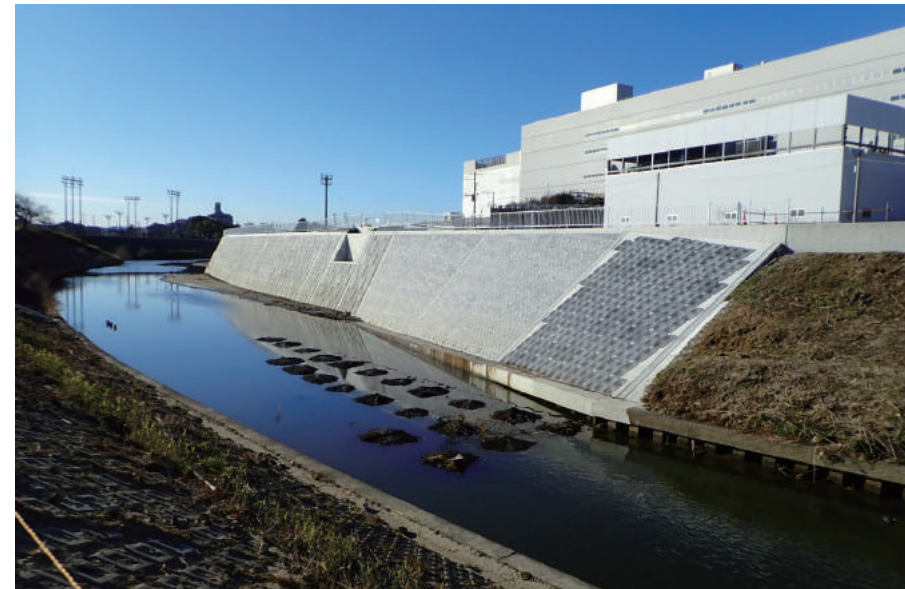
広域河川改修（連携）工事 （一宮川局部改良護岸工その3）

〒299-4104 茂原市南吉田 3644-1 TEL : 0475-34-8311 FAX : 0475-34-7331 URL https://www.midorikawagumi.co.jp/