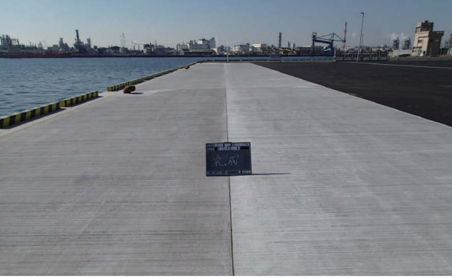
県単港湾整備（港建特別）及び県単港湾整備 合併工事（八幡地区市原ふ頭A岸壁舗装工） 現場代理人/主任技術者 鈴木敏夫

〒290-0066 市原市五所 107 TEL : 0436-41-3732 FAX : 0436-41-3728 URL https://www.nanbu1964.com/