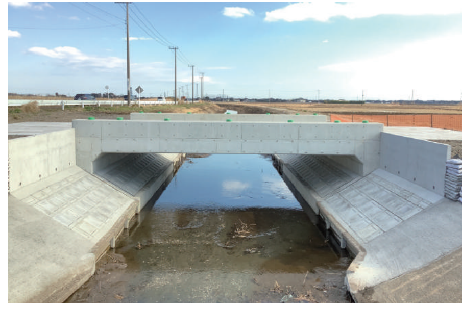
豊和 排水路横断工事

〒289-0515 旭市入野 1367 TEL : 0479-68-3150 FAX : 0479-68-4046