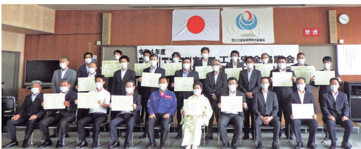
21年度 利根川下流河川 優良工事等表彰