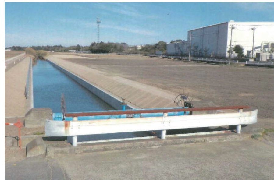
蓮沼2期 (2工区) R 2排水路護岸工事 (その1)

〒289-1733 山武郡横芝光町栗山 3195-1 TEL: 0479-82-3311 FAX: 0479-82-3314