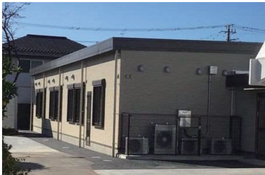
君津児童相談所一時保護所棟増築工事

〒292-0067 木更津市中央 1-5-9 TEL: 0438-23-3211 FAX: 0438-23-6017 URL http://kimitetsu.co.jp/