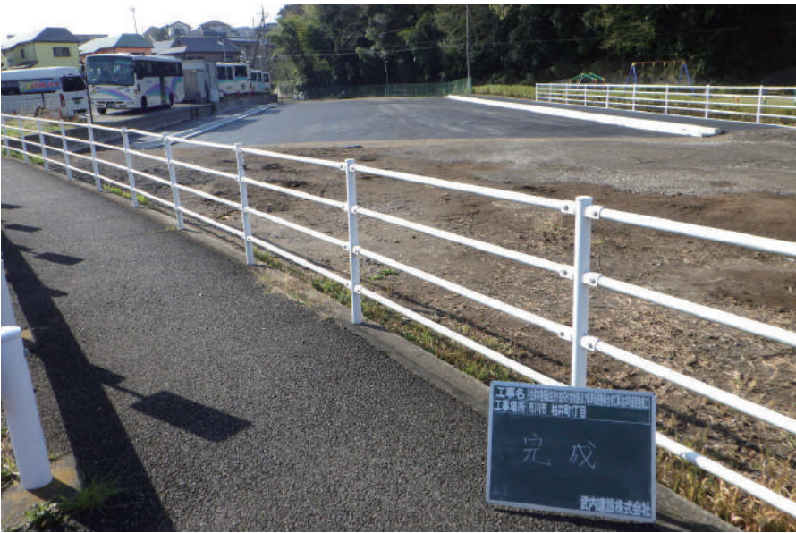
社会資本整備総合交付金(交付金街路)及び 県単街路整備合併工事(柏井町道路整備工)

〒272-0802 市川市柏井町 2-1426 TEL: 047-337-4749 FAX: 047-337-4756