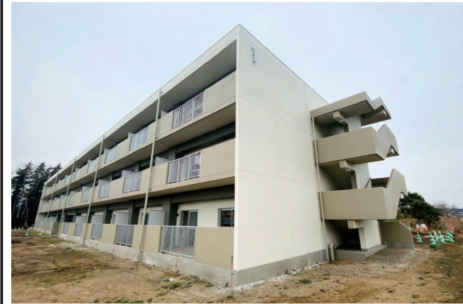
(仮称)佐津間県営住宅第1期建築工事 (令和元年度事業)

〒289-1726 山武郡横芝光町木戸 10110 TEL: 0479-84-1221 FAX: 0479-84-0179 URL https://www.abiru-const.co.jp/