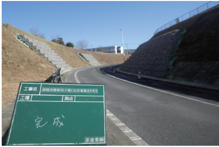
道路災害復旧工事 (元災道第 4 4 号)

〒270-1353 印西市泉 81 TEL : 0476-47-5055 FAX : 0476-46-2617