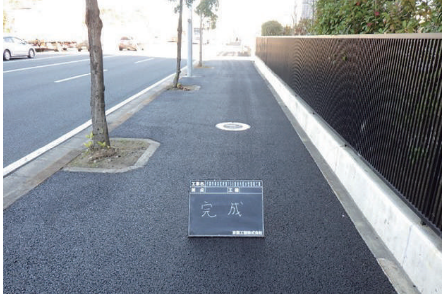
千葉市美浜区新港198番地先配水管整備工事

〒261-0002 千葉市美浜区新港 139-2 TEL : 043-248-1471 FAX : 043-241-1875 URL https://www.keiyo-koukan.co.jp/