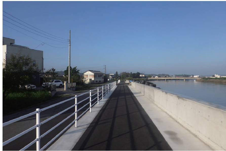
広域河川改修(復興)工事(一宮川護岸工その23)

〒289-1726 山武郡横芝光町木戸 10110 TEL: 0479-84-1221 FAX: 0479-84-0179 URL https://www.abiru-const.co.jp/