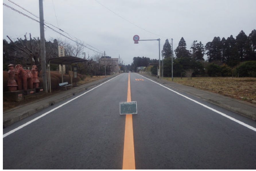
県単舗装道路修繕工事(小池工区)

〒289-1603 山武郡芝山町大里 1553-3 TEL: 0479-78-1131 FAX: 0479-78-0646 URL https://www.hagiwaradoken.jp/