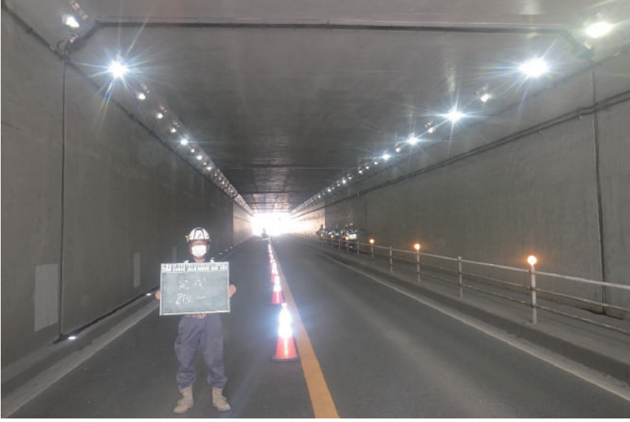
防災・安全交付金(災害防除)及び 県単災害防止合併工事(駒井野隧道補修工)

〒289-1603 山武郡芝山町大里 1553-3 TEL: 0479-78-1131 FAX: 0479-78-0646 URL https://www.hagiwaradoken.jp/