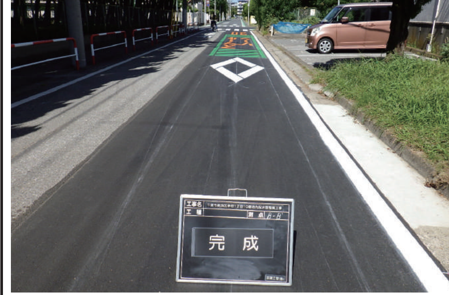
千葉市美浜区幸町1丁目10番地先配水管整備工事

〒261-0002 千葉市美浜区新港 139-2 TEL : 043-248-1471 FAX : 043-241-1875 URL https://www.keiyo-koukan.co.jp/