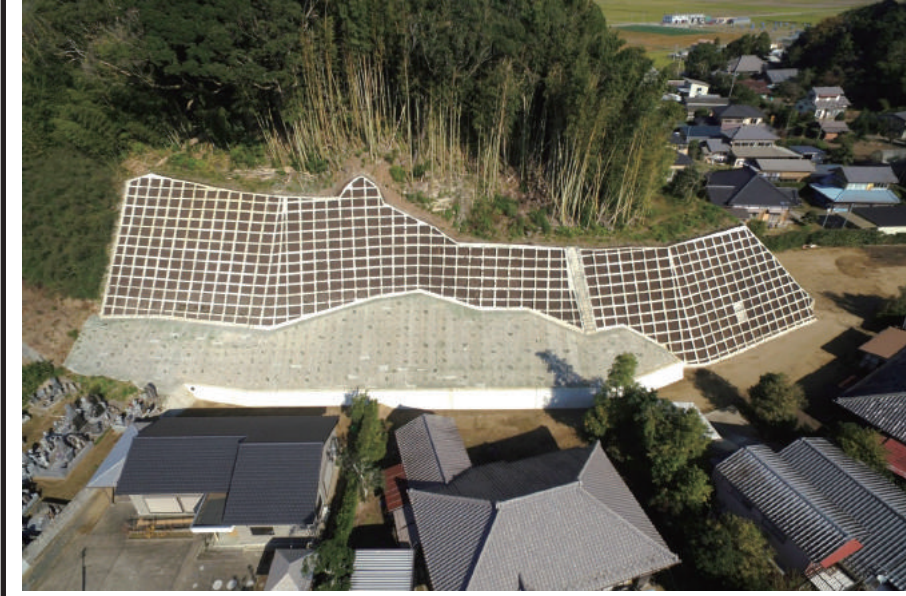
予防治山工事(篠本)

〒289-1603 山武郡芝山町大里 1553-3 TEL: 0479-78-1131 FAX: 0479-78-0646 URL https://www.hagiwaradoken.jp/