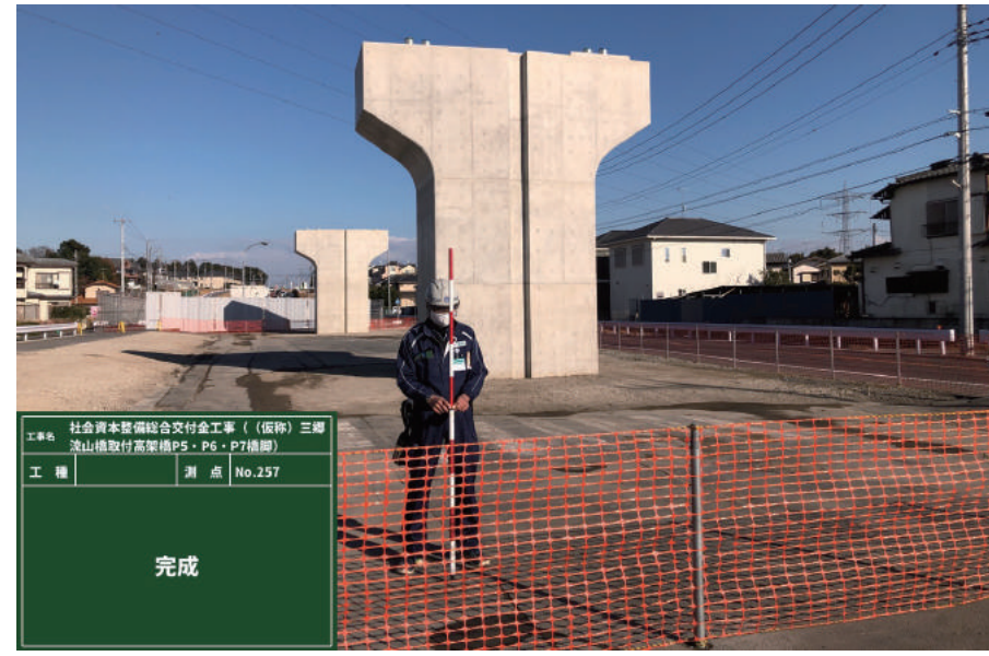
社会資本整備総合交付金工事 ((仮称) 三郷流山橋取付高架橋 P 5・P 6・P 7 橋脚)

〒270-2253 松戸市日暮 5-25 TEL : 047-387-2281 FAX : 047-387-2285 URL http://www.yuasakensetu.co.jp/