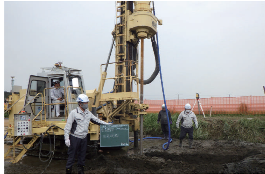
ふさのくに観光道路及び県単道路改良 (幹線) 合併工事 (新宿地盤改良工その 2)

〒287-0002 香取市北 2-6-3 TEL : 0478-55-1511 FAX : 0478-55-1460 URL http://www.ishiicon.co.jp/