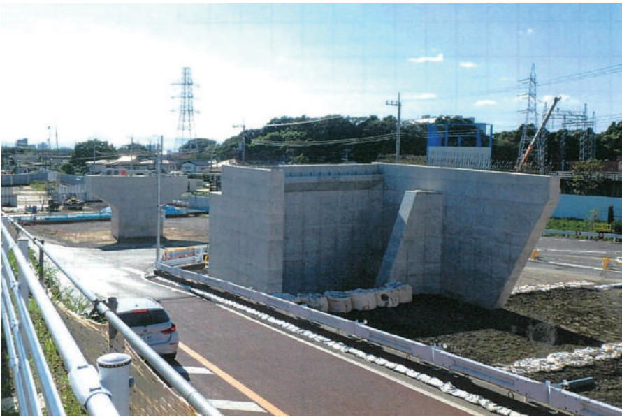
社会資本整備総合交付金工事 (仮称)三郷流山橋取付高架橋P10橋脚・A2橋台)

〒260-0842 千葉市中央区南町 2-13-12 TEL: 043-265-5551 FAX: 043-265-6445 URL http://www.takumi-kk.jp/