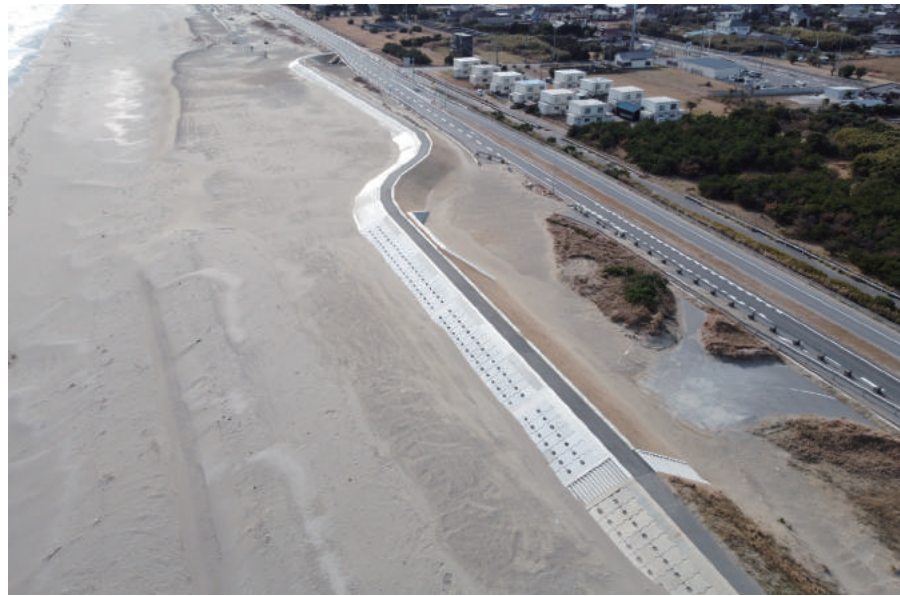
海岸基盤整備 (復興) 工事 (護岸工その 1 2)

〒299-3211 大網白里市細草 1624-1 TEL : 0475-77-6111 FAX : 0475-77-6115 URL https://suzuki-doken.co.jp/