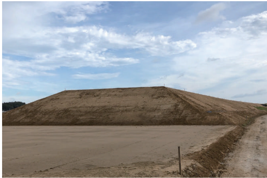
国道道路改築工事 (八日市場ホ地区道路改良工その 5)

〒289-2147 匝瑳市飯倉 284 TEL : 0479-72-2585 FAX : 0479-73-6882