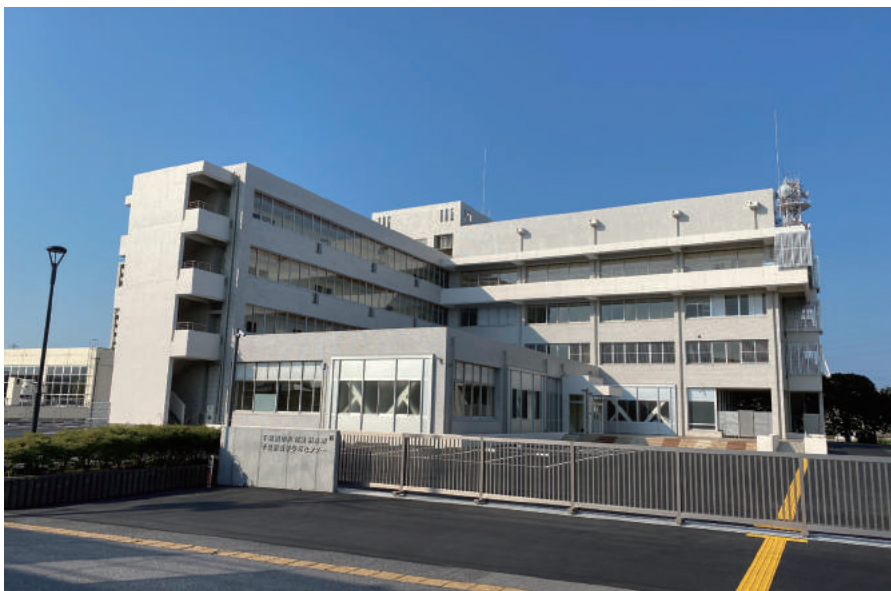
旧青少年女性会館大規模改修衛生設備工事

〒263-0016 千葉市稲毛区天台 4-1-12 TEL: 043-254-2323 FAX: 043-255-1816 URL http://www.daiwa-tc.co.jp/