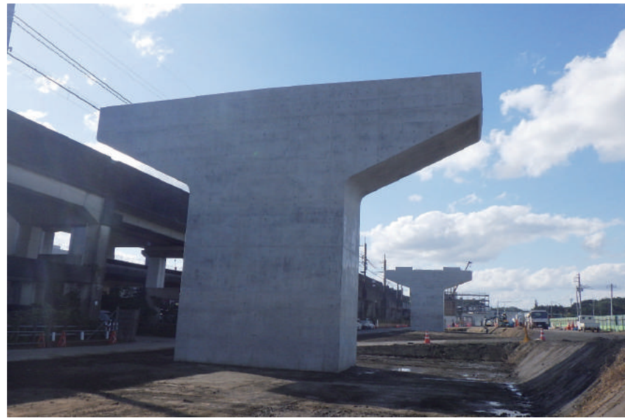
社会資本整備総合交付金工事 (仮称)下山金橋P12・P14橋脚)

〒261-0026 千葉市美浜区幕張西 3-1-15 TEL: 043-271-5191 FAX: 043-276-3261 URL https://www.ichiharagumi.com/