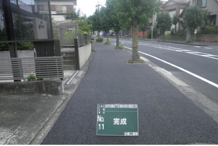
成田市橋賀台1丁目2番地先配水管整備工事

〒273-0853 船橋市金杉 4-5-18 TEL : 047-448-3624 FAX : 047-448-3630 URL https://www.furuhashisetsubi.co.jp/