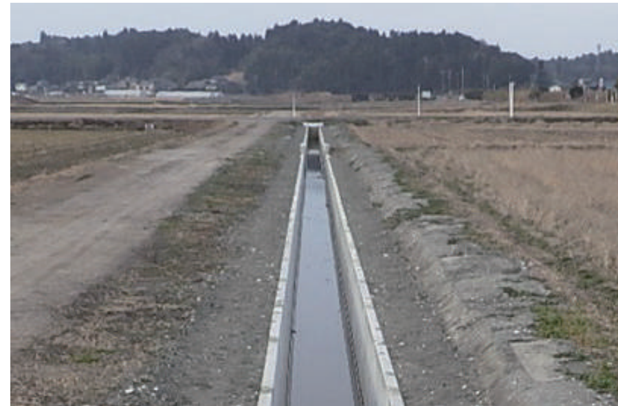
豊和 排水路護岸工事 (その2)

〒289-0515 旭市入野 1367 TEL: 0479-68-3150 FAX: 0479-68-4046