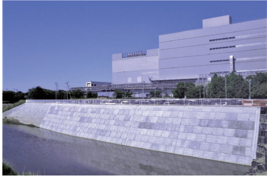
広域河川改修工事 (一宮川局部改良護岸工その 2)

〒299-4104 茂原市南吉田 3644-1 TEL : 0475-34-8311 FAX : 0475-34-7331 URL https://www.midorikawagumi.co.jp/