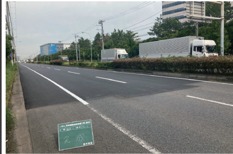
県単舗装道路修繕工事(茜浜)

〒261-0026 千葉市美浜区幕張西 3-1-15 TEL: 043-271-5191 FAX: 043-276-3261 URL https://www.ichiharagumi.com/