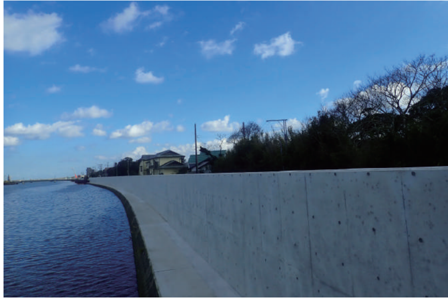
広域河川改修 (復興) 工事 (一宮川護岸工その 2 0)

〒299-4301 長生郡一宮町一宮 3178 TEL : 0475-42-3633 FAX : 0475-42-6097 URL http://kataoka-kogyo.com/company.html