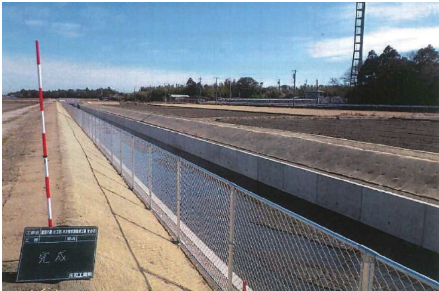
蓮沼2期 (2工区) R 2排水路護岸工事 (その2)

〒283-0811 東金市台方 2078 TEL: 0475-54-3451 FAX: 0475-54-3455