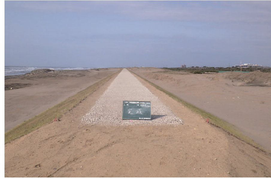
海岸基盤整備 (復興) 工事 (築堤工その 2 0)

〒289-1305 山武市本須賀 3718 TEL : 0475-77-8677 FAX : 0475-77-8676