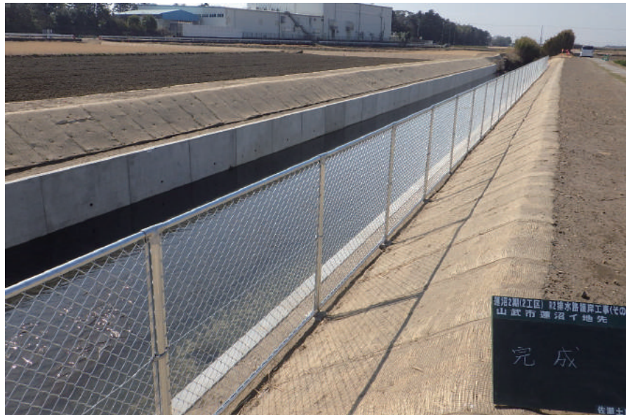
蓮沼2期 (2工区) R 2排水路護岸工事 (その3)

〒289-1802 山武市蓮沼口 3129 TEL: 0475-86-3141 FAX: 0475-86-3143