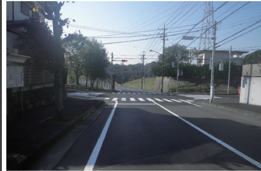
第二北総～成田線第5号(その7) φ600mm送水管布設工事

〒286-0115 成田市西三里塚 1-63 TEL : 0476-33-6663 FAX : 0476-35-5055