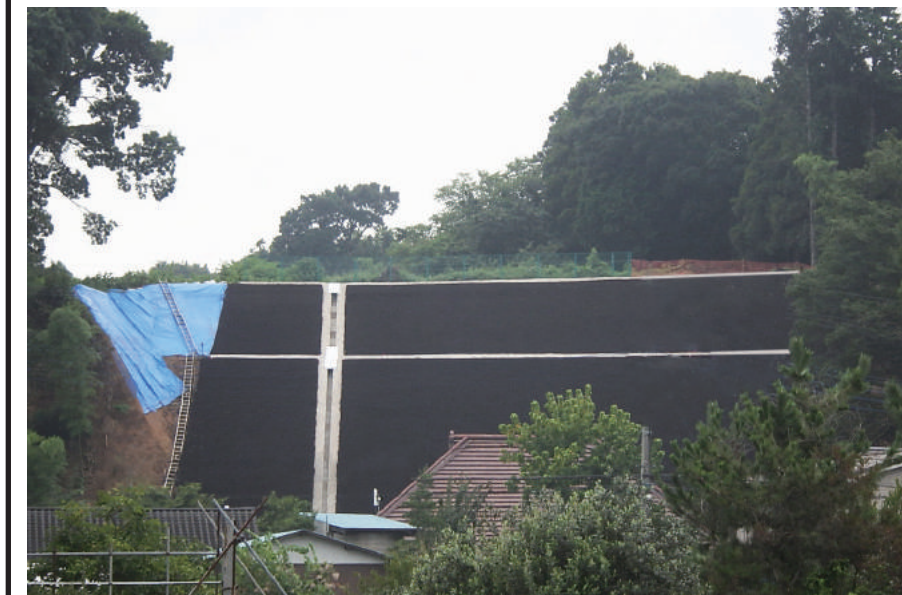
急傾斜地崩壊対策工事(北須賀和田2法面保護工)

〒286-0003 成田市台方 309-2 TEL : 0476-28-1900 FAX : 0476-28-1901 URL https://www.odakakogyo.co.jp/