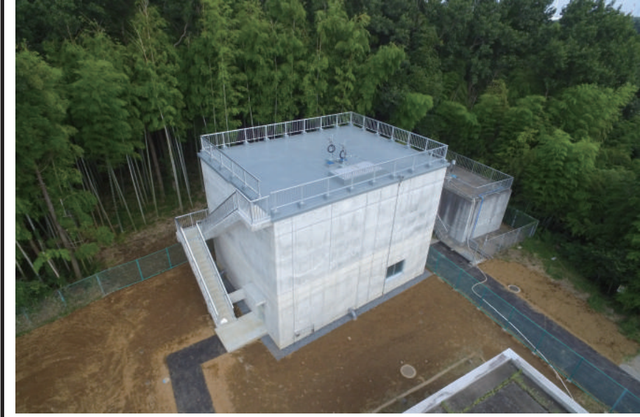
椎の森配水槽築造工事

〒260-0842 千葉市中央区南町 2-13-12 TEL: 043-265-5551 FAX: 043-265-6445 URL http://www.takumi-kk.jp/