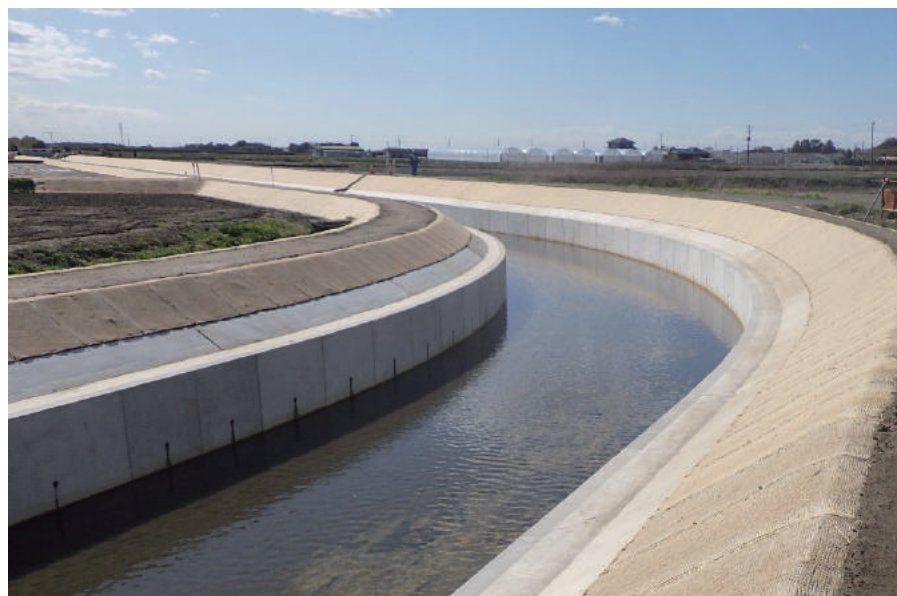
蓮沼2期(2工区)排水路護岸工事(その3)

〒289-1802 山武市蓮沼口 3129 TEL: 0475-86-3141 FAX: 0475-86-3143