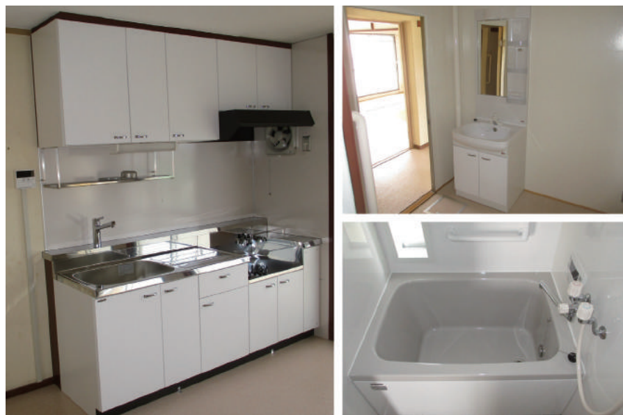
北子安県営住宅 6号棟住居改善工事 (平成30年度)

〒299-1121 君津市常代 1-12-26 TEL : 0439-55-6511 FAX : 0439-52-5676 URL http://www.aisei-ken.com/