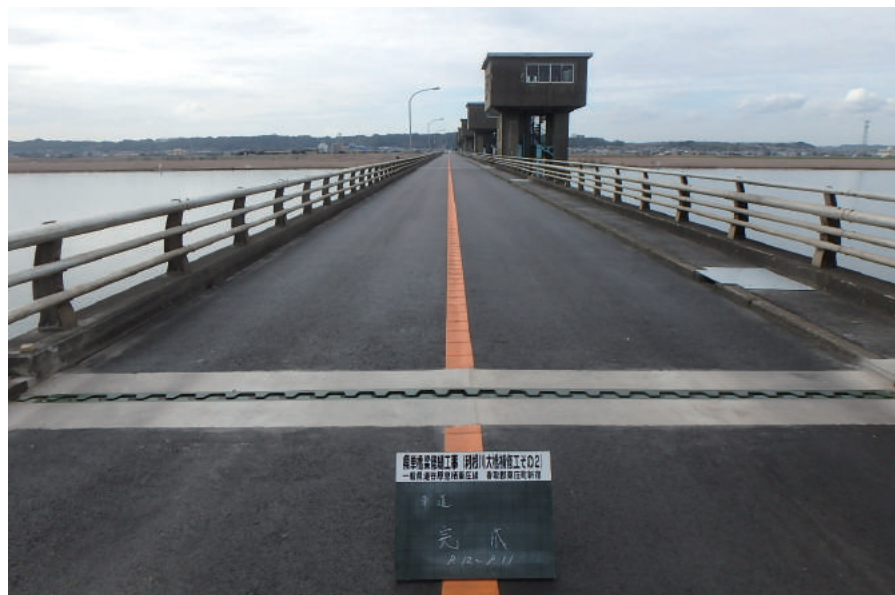
県単橋梁修繕工事(利根川大橋補修工その2)

〒289-0411 香取市府馬 2957-1 TEL : 0478-78-3131 FAX : 0478-78-3470 URL https://maekenkatori.jimdofree.com/