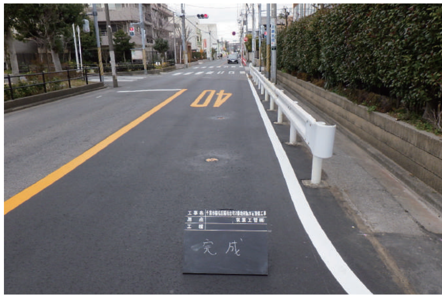
千葉市稲毛区稲毛台町 2 番地先配水管整備工事

〒261-0002 千葉市美浜区新港 139-2 TEL : 043-248-1471 FAX : 043-241-1875 URL http://www.keiyo-koukan.co.jp