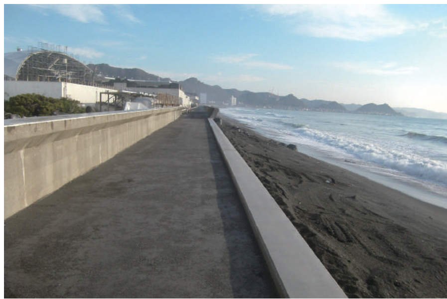
海岸基盤整備工事 (東町・止水矢板工)

〒296-0044 鴨川市広場 933 TEL : 04-7092-2358 FAX : 04-7092-2360 URL http://www.jumonji.com/