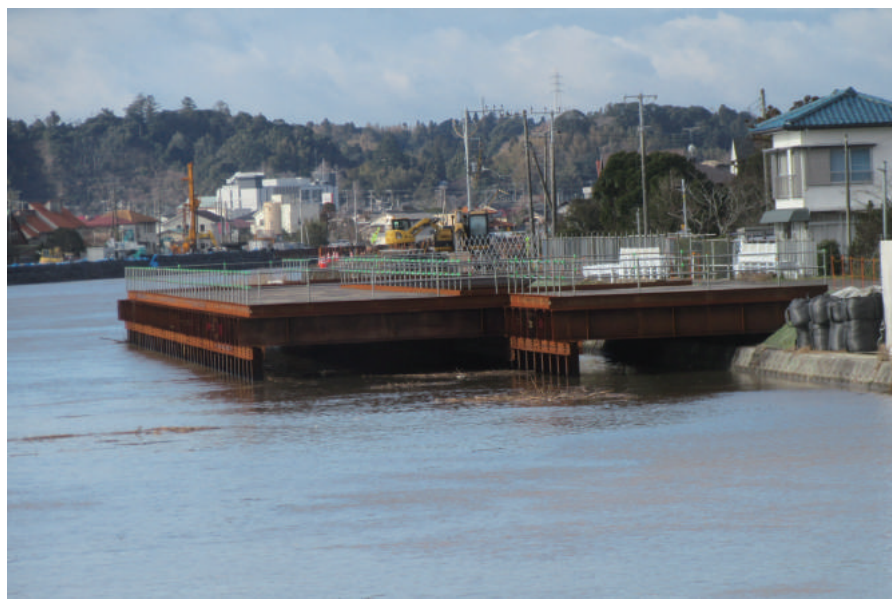
広域河川改修 (復興) 工事 (一宮川仮棧橋工)

〒299-4301 長生郡一宮町一宮 3178 TEL : 0475-42-3633 FAX : 0475-42-6097 URL http://kataoka-kogyo.com/company.html