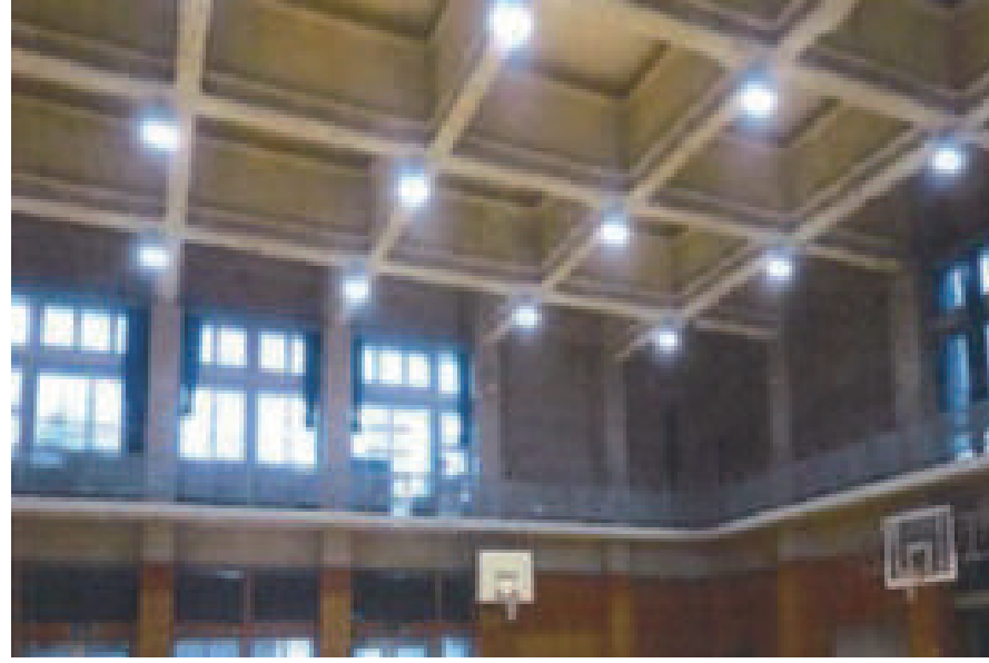
千葉県立幕張総合高等学校 体育棟天井撤去電気設備工事

〒264-0036 千葉市若葉区殿台町 127-1 TEL: 043-290-0038 FAX: 043-290-0039 URL http://kominedengyou.co.jp/