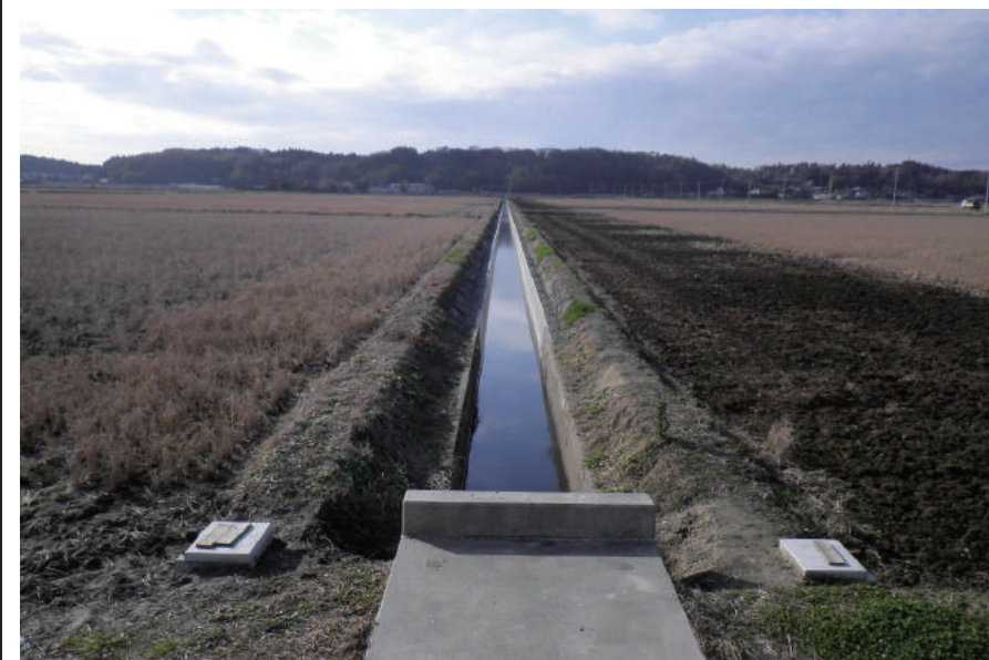
椿海 排水路護岸工事(その1)

〒289-1726 山武郡横芝光町木戸 10110 TEL: 0479-84-1221 FAX: 0479-84-0179 URL http://www.abiru-const.co.jp/