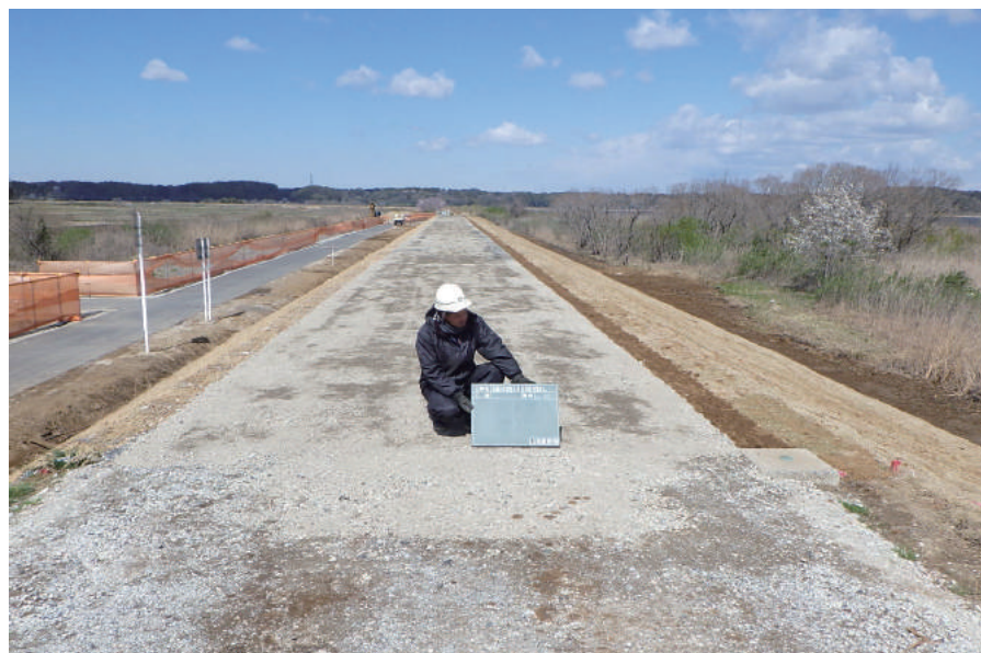
広域河川改修工事(西印旛沼築堤工)

〒285-0065 佐倉市直弥 59-1 TEL : 043-498-1211 FAX : 043-498-1550