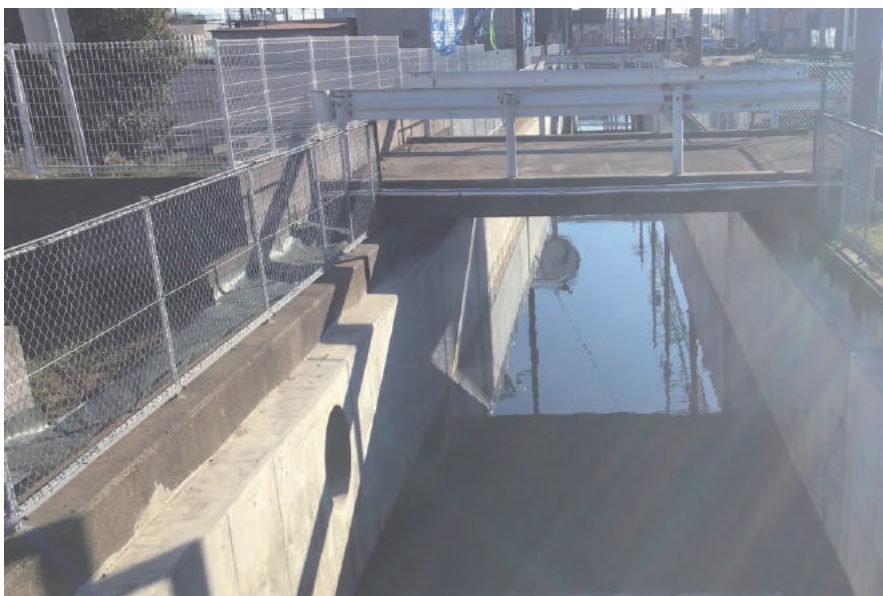
仁玉川 排水路護岸工事

〒289-2504 旭市二 528 TEL: 0479-62-1221 FAX: 0479-63-7171 URL http://www.abeken.co.jp/