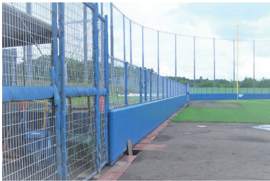
県単公園整備工事 (長生の森・ラバーフェンス改修)

〒299-4104 茂原市南吉田 3644-1 TEL : 0475-34-8311 FAX : 0475-34-7331 URL https://www.midorikawagumi.co.jp/