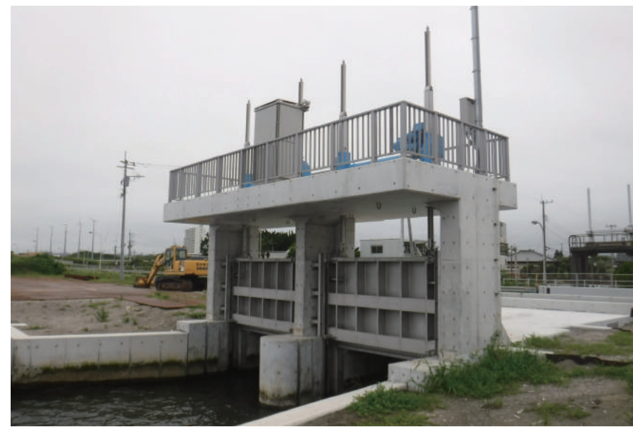
広域河川改修 (復興) 工事 ((仮称)一宮川第2 樋門工)

〒299-4301 長生郡一宮町一宮 3178 TEL : 0475-42-3633 FAX : 0475-42-6097 URL http://kataoka-kogyo.com/company.html