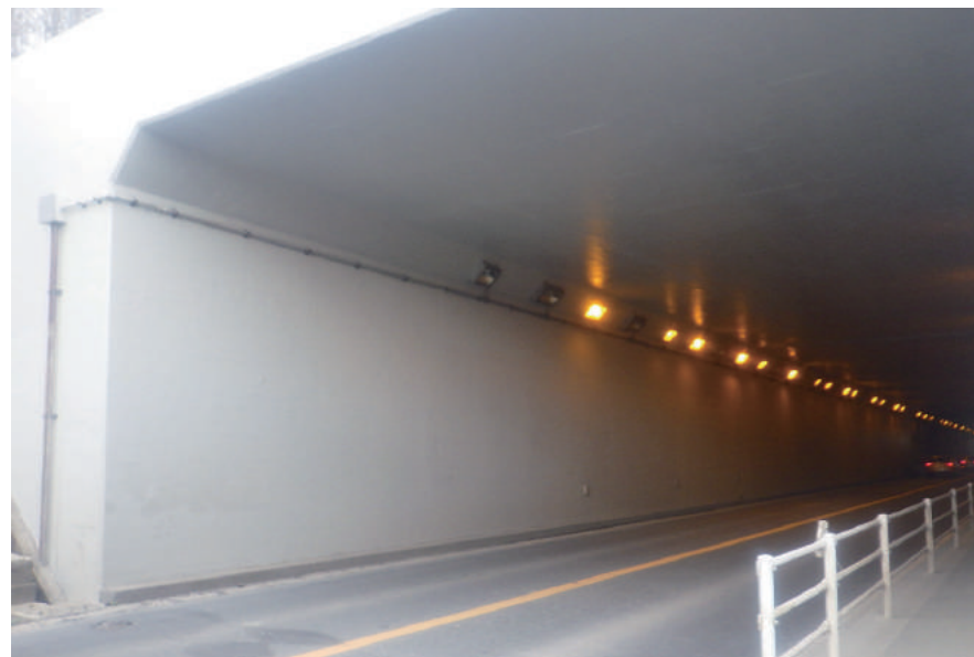
防災・安全交付金(災害防除)工事 (駒井野隧道補修工)

〒286-0133 成田市吉倉 150-18 TEL : 0476-22-7301 FAX : 0476-22-7304 URL http://www.toho-const.co.jp/