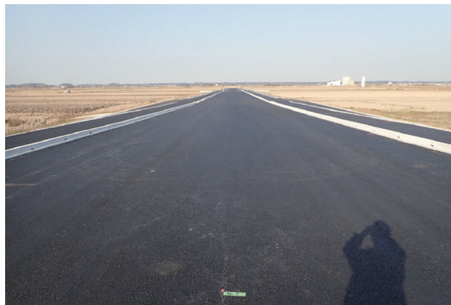
社会資本整備総合交付金(住宅)工事(松虫改良工)

〒270-2327 印西市竜腹寺 598-2 TEL : 0476-97-1133 FAX : 0476-97-1508 URL http://takeuchi-kensetsu.com/