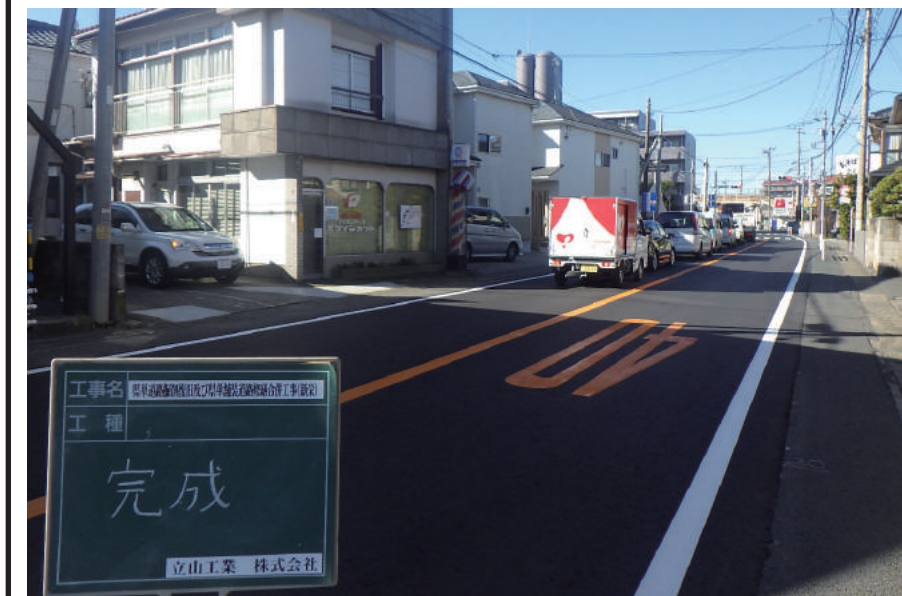
県単道路掘削復旧及び 県単舗装道路修繕合併工事(新栄)

〒262-0011 千葉市花見川区三角町 178 TEL : 043-259-0378 FAX : 043-250-2935 URL http://tateyamakogyo.co.jp/