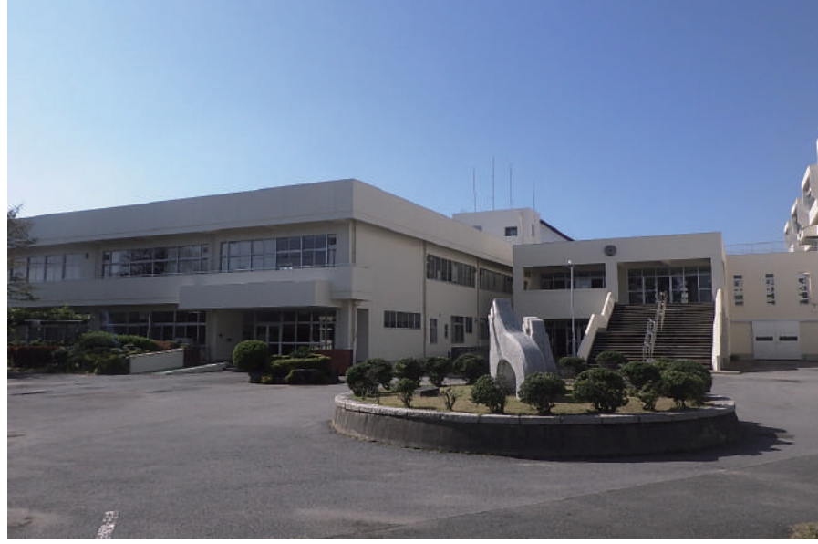
千葉県立松戸国際高等学校 校舎(管理棟外)外壁改修他工事

〒270-2253 松戸市日暮 5-25 TEL: 047-387-2281 FAX: 047-387-2285 URL http://www.yuasakensetu.co.jp/