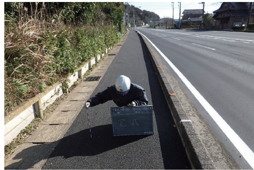
市原市迎田 1 1 5 番地先配水管整備工事

〒261-0026 千葉市美浜区幕張西 3-1-15 TEL : 043-271-5191 FAX : 043-276-3261 URL https://www.ichiharagumi.com/