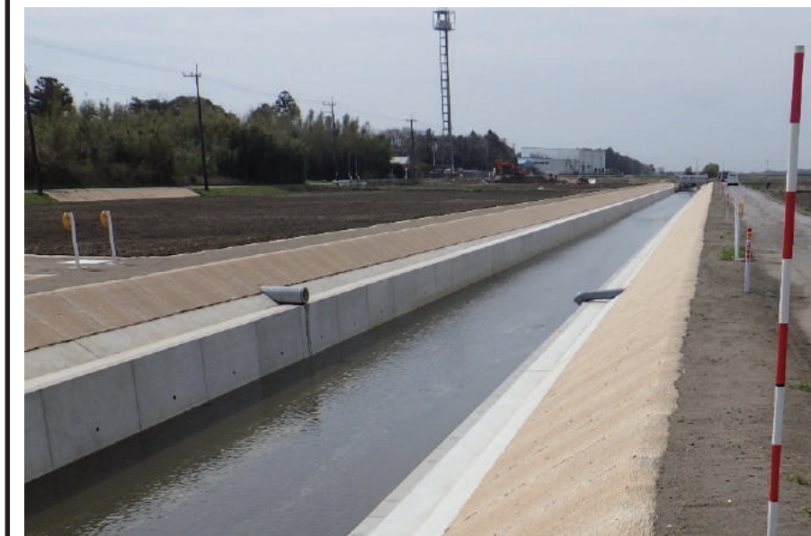
蓮沼2期(2工区)排水路護岸工事(その1)

〒289-1733 山武郡横芝光町栗山 3195-1 TEL : 0479-82-3311 FAX : 0479-82-3314 URL http://www.furuya-con.co.jp/