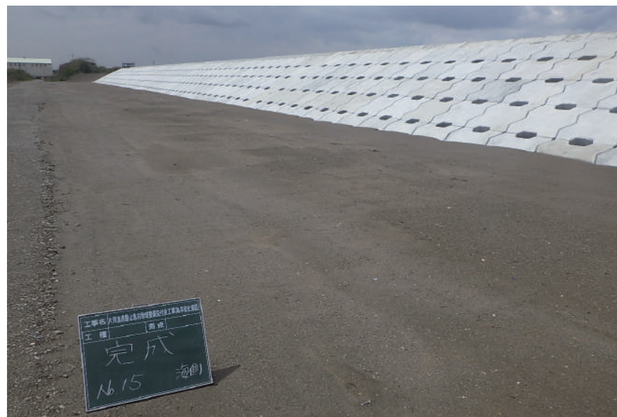
片貝漁港農山漁村地域整備交付金工事 (海岸保全施設)

〒299-3211 大網白里市細草 1624-1 TEL : 0475-77-6111 FAX : 0475-77-6115 URL http://suzuki-doken.co.jp/