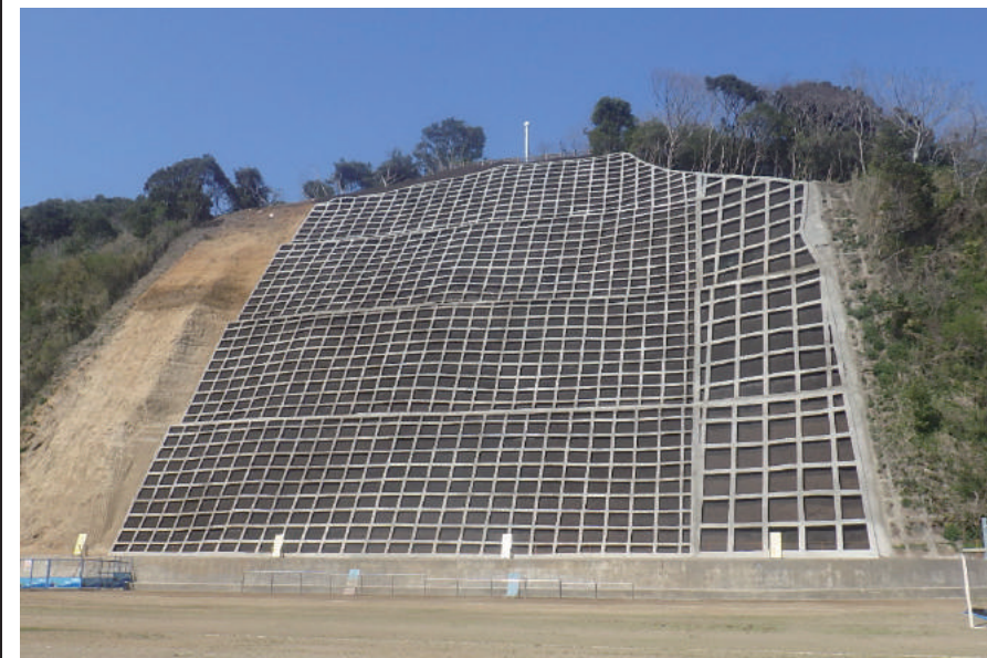
緊急予防治山工事(櫻井)

〒289-1603 山武郡芝山町大里 1553-3 TEL: 0479-78-1131 FAX: 0479-78-0646 URL https://www.hagiwaradoken.jp/