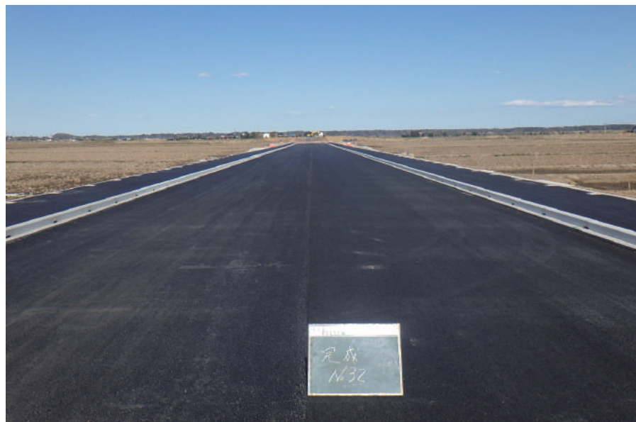
社会資本整備総合交付金(住宅)及び 県単道路改良(幹線)合併工事(萩原干拓改良工)

〒289-1603 山武郡芝山町大里 1553-3 TEL: 0479-78-1131 FAX: 0479-78-0646 URL https://www.hagiwaradoken.jp/