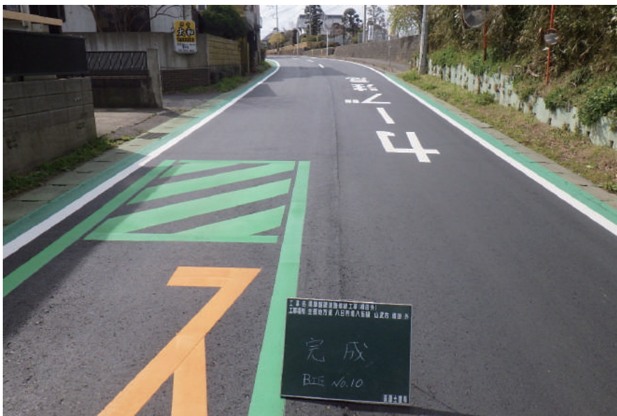
県単舗装道路修繕工事(横田外)

〒289-1603 山武郡芝山町大里 1553-3 TEL: 0479-78-1131 FAX: 0479-78-0646 URL https://www.hagiwaradoken.jp/