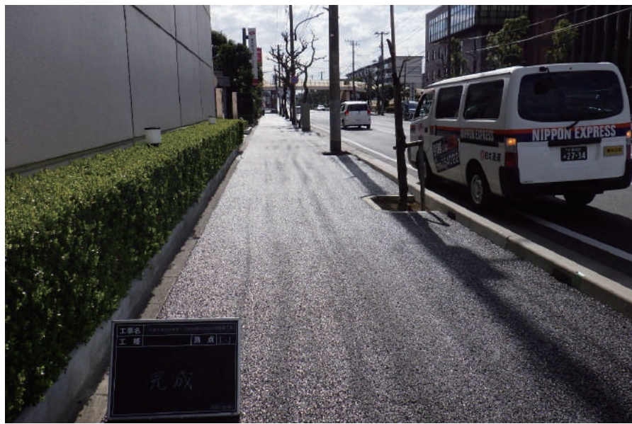
千葉市美浜区幸町 1 丁目 2 6 番地先配水管整備工事

〒261-0002 千葉市美浜区新港 139-2 TEL : 043-248-1471 FAX : 043-241-1875 URL http://www.keiyo-koukan.co.jp