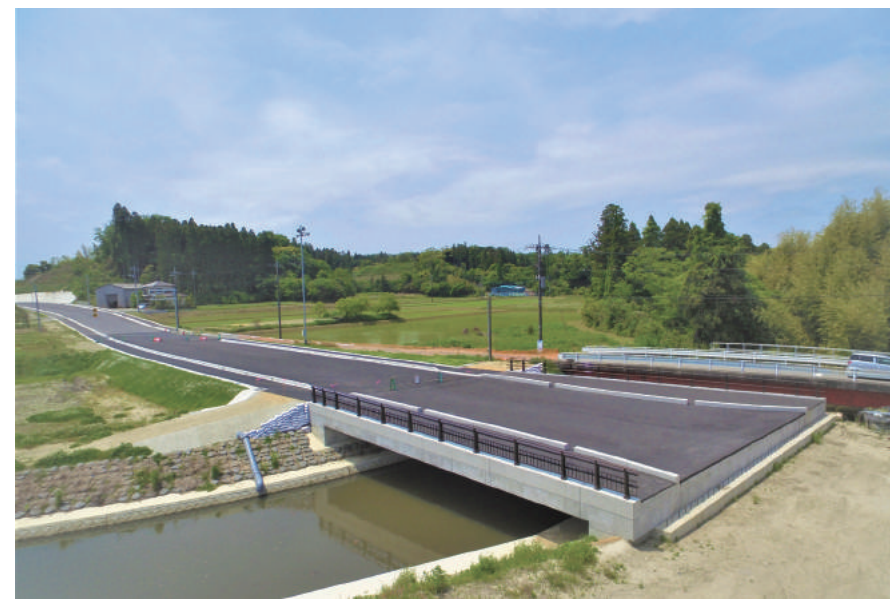
社会資本整備総合交付金及び県単道路改良 (幹線) 合併工事 (国府関・橋梁取付道路工)

〒299-4104 茂原市南吉田 3644-1 TEL : 0475-34-8311 FAX : 0475-34-7331 URL https://www.midorikawagumi.co.jp/