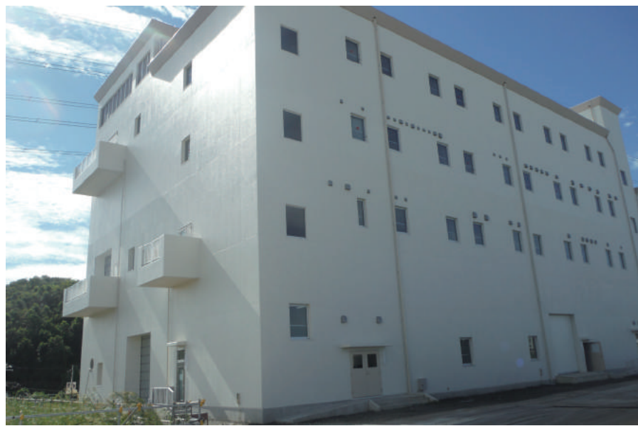
江戸川第一終末処理場汚泥処理施設建築工事

〒272-0812 市川市若宮 3-1-18 TEL : 047-335-0234 FAX : 047-335-2701 URL http://www.kamijyo.co.jp/