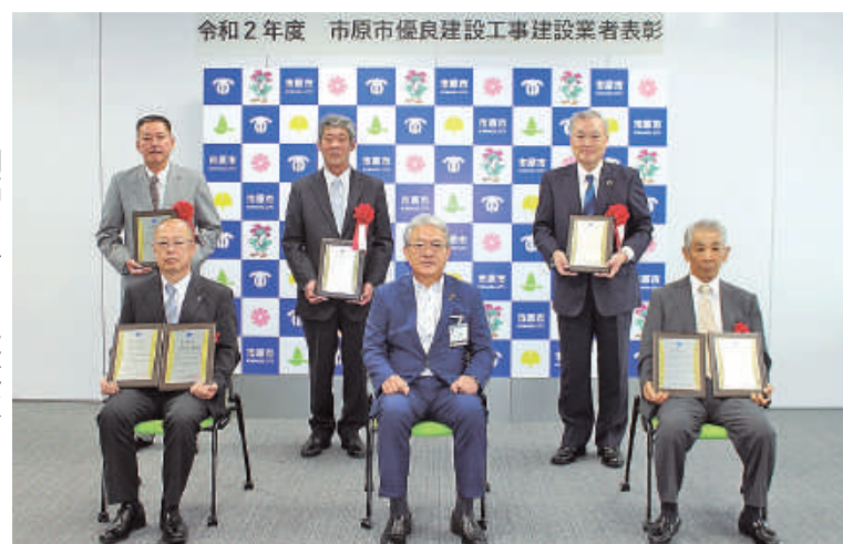
間隔を空けて記念撮影