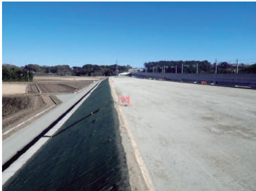
北千葉道路北須賀・押畑地区改良その2(畔蒜工務店)