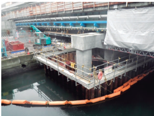
国道357号架橋下部(その1)(東邦建設)