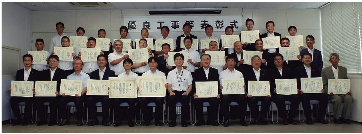
千葉国道事務所 2015年度優良工事等表彰式