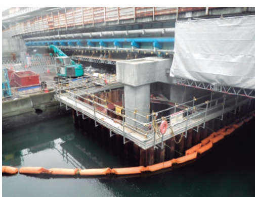
国道357号架橋下部(その1)