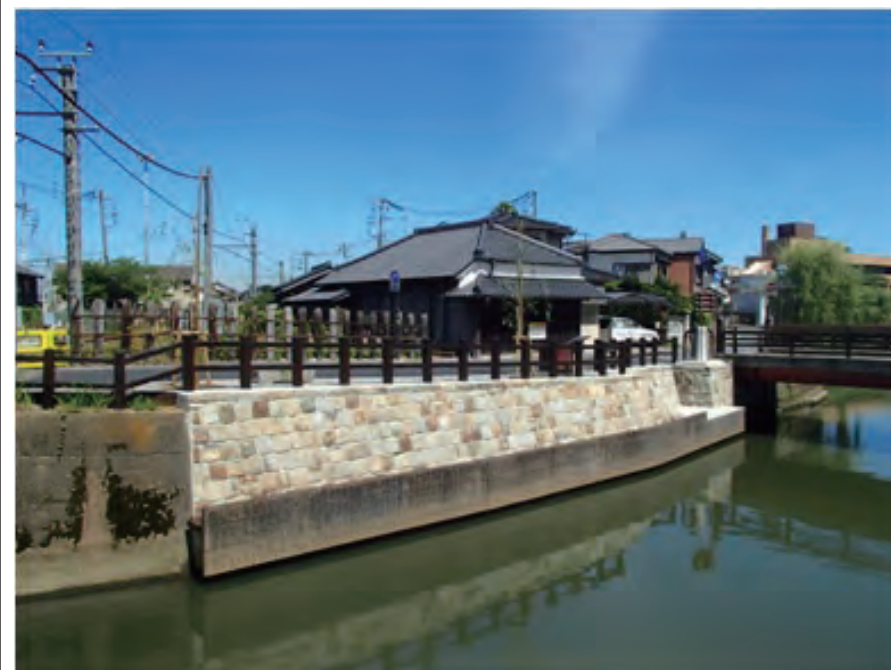
総合流域防災工事(護岸工)

〒287-0003 香取市佐原イ 2587-1 TEL 0478-54-3511 FAX 0478-54-3320