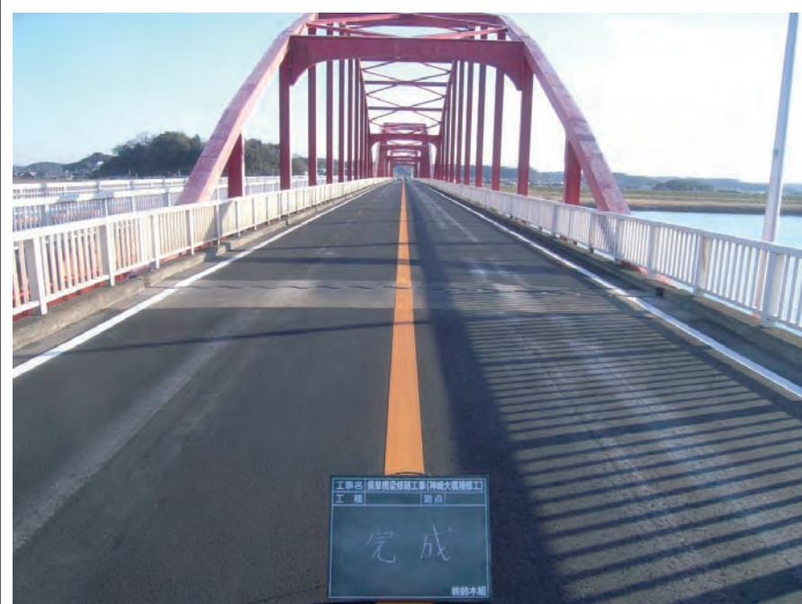
県単橋梁修繕工事(神崎大橋補修工)