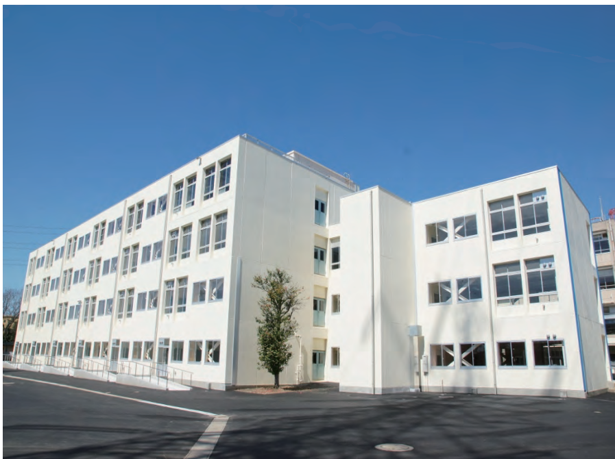
千葉県立船橋特別支援学校(仮称)船橋旭分校校舎 (普通教室棟外)大規模改造他建築工事

〒287-0001 香取市北 2-6-3 TEL 0478-55-1511 FAX 0478-55-1460 URL http://www.ishiicon.co.jp